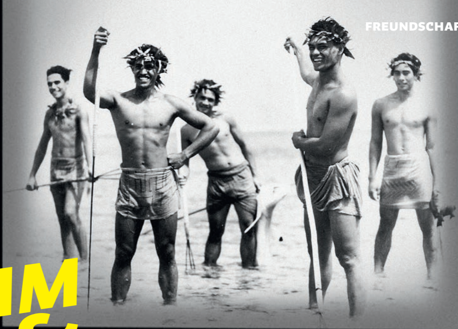
FREUNDSCHAFT. LIEBE. WELT.