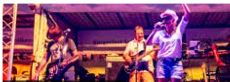
19.30 Uhr Prime Time