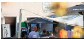
45 CAFE FUX