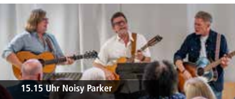
15.15 Uhr Noisy Parker