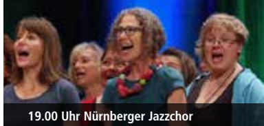
19.00 Uhr Nürnberger Jazzchor