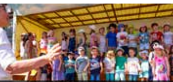
16.05 Uhr W.-B.-Kindergarten

23.30 Uhr Programmende des ersten Tages des 45. Schwabacher Bürgerfests... gern weiter essen und trinken bis 0.30 Uhr .