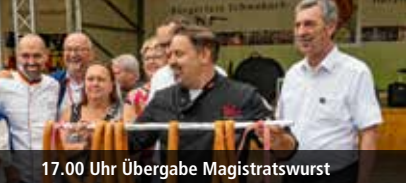
17.00 Uhr Übergabe Magistratswurst