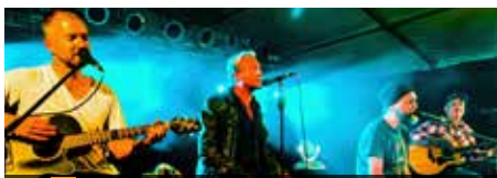
10 Fr. 19.00 Uhr Retale