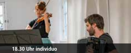
18.30 Uhr individuo