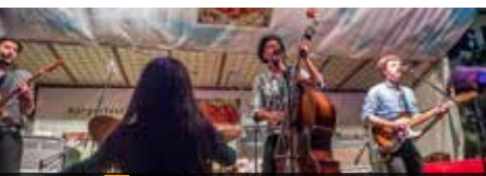
43 Sa. 20.00 Uhr Smokestack Lightnin'