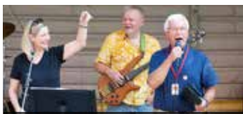
15.00 Uhr Hot Skills