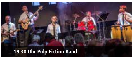
19.30 Uhr Pulp Fiction Band