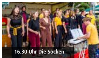
16.30 Uhr Die Socken