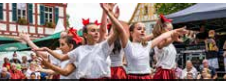
12.00 Uhr Kunststück – Schule für Tanz